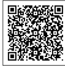
スマートフォン用QRコード