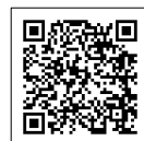
お問い合わせページ (QR コード)