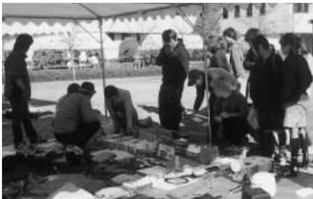
フリーマーケット

13年度は、短大と別個に開催することになり、準備期間も極めて短かつたにも拘わらず実行委員を先頭に立派に立ち上げた努力をたたえたい。