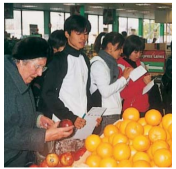
スーパーマーケットでのショッピング実習

今回の語学研修のハイライトは、全てのホストファミリー、CCELの先生方が集まってのお別れパーティであった。学生たちは、修了証書が授与された後、お礼にニュージージーランドや日本の歌をうたったり、ケン玉を披露した。彼らはCCELの先生方、他のホストファミリー、シスターたちと解け合つて、なごやかに心の交流ができたと思つた。