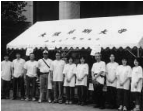
世話役会のメンバー

8月1日PL花火大会の日に、絶好の見物場所となる本学の中庭を開放することになり、事務職員有志で「大学開放世話役会」を組織し、地元住民、高等学校などへの案内状配布、運営計画策定(警備員の配置、簡易トイレの設置、うちわ・ジュースの配布、くじ引きなど)を行って当日の運営にあたり、地域の方々にとときを楽しんでいただいた。 約1,200人がおいでになり、壮大な花火を堪能。