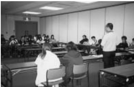
クラスミーティング