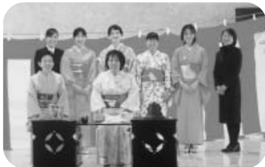
「尚徳庵」のみなさん