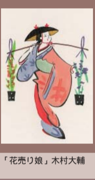
「花売り娘」木村大輔

このたび石原セミナーにおける数十名の学生大津絵作品の中から二点をえらび掲載することにしました。あとは、本紙次号について掲載予定。