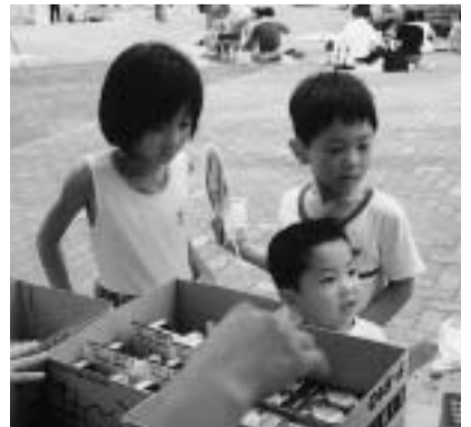
景品、何もらおこな?