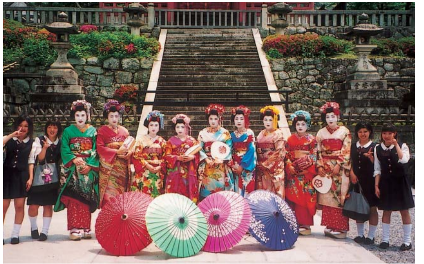
修学旅行生と一緒に