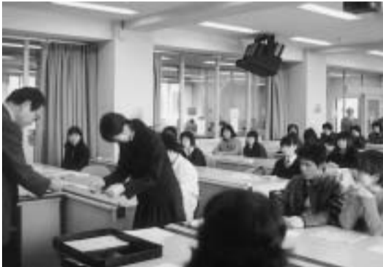
上：AE入学許可書交付風景

このAE入学制度で重視するのは、本学で学びたいという強い意志、意欲であり、本年度は、37名という昨年度以上のAE相談者があって、うち33名が登録を行った。