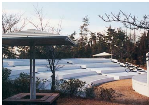
屋外ステージ観覧席

等学校陸上競技部生徒を招き、走り初めをする。 招待選手 ・為末 大(世界選手権入賞400mH) ・森長正樹(走り幅跳び8m25現日本記録保持者) ・森田真治(400m45秒44・1999年日本ランク1位) ・小崎まり(世界選手権女子10000m出場・日本代表候補(国際横浜大会)優勝) ・インターネット接続環境改善!既存の専用回線と比べると10倍以上のスピードの専用回線(常時1.5Mbpsを確保)に移行する。インターネット接続に関する不満や苦情はこれで改善される。課題等の調べものや就職情報の収集などに、大いに活用してほしい。