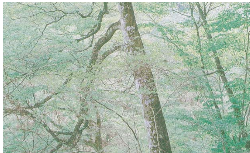
森林浴に来ませんか?

平成13年度から進められている学内教育環境整備の計画と進捗状況は次のとおり。 ・学生専用駐輪場を9月1日に完成し、秋冬期から使用を開始される。 ・西館と学生食堂との間に研究棟(三階建 教育研究室8室)を9月1日に完成。 ・野外ステージ観覧席の大改修工