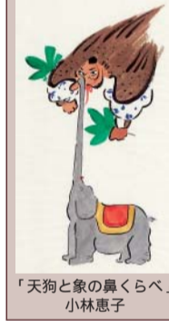
「天狗と象の鼻くらべ」小林恵子