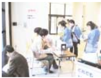
大学祭に出店された「古本市」

11月20日(土)に行われた大学祭において、図書館では、「古本市」を出店しました。 参加の学生、教職員の皆様のご協力により125冊の売上がありました。なおこの収益金は、当初の予定どおり、学生に還元するためDVDソフトを購入することになっております。