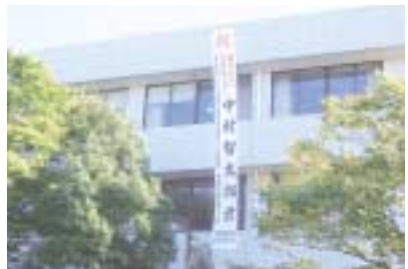
メダル獲得をたたえる垂れ幕