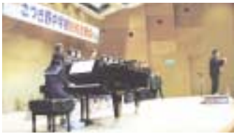
クラスの名誉をかけてピアノ(ペーゼンドルファー)に合わせて合唱

地元的美原町立さつき野中学校の第20回(2004年)校内音楽会が、11月6日(土)10時より、足立記念館3Fで開催された。当日は好天に恵まれ、会場には早くから、学校関係者・保護者が入場され、ほぼ満席の大盛況だった。 今年は、さつき野小学校の5年生、6年生が特別参加して発表を行い、大きな声援と拍手が送られた。昨年同様クラス対抗が行われ、課題曲と自由曲2曲を発表し、出来栄を競った。満員の会場からは声援や拍手が鳴りやまず、大変な盛り上がりであった。 本校のキャンパス施設が地元の人々に利用され、貢献することができればと思いつつ、さつき野中学校校内音楽会をますますの発展を心から祈りたい。