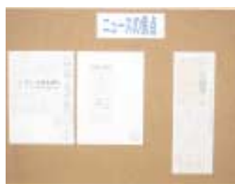
設置された『ニュースの焦点』コーナー

大学図書館の役割は、学生の皆さんの学修・研究をはじめとして就職活動資格の取得・クラブ活動・余暇を利用した趣味など、極めて多様な「キャンパス・ライフ」をサポートすることにあります。 ところで、今の若い人は、新聞・雑誌、本などをほとんど読まなくなっています。今、図書館では種々の新聞・雑誌を購入し、配架しています。 そこで図書館では、学生の皆さんにより充実した「キャンパス・ライフ」を過ごしてもらうため、図書館の資料の中から学生の皆さんに「ぜひ」読んでほしい記事を抜粋掲載することにしました。 本コーナーは11月下旬に設置しましたので、