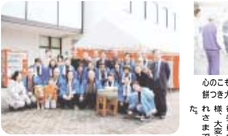
チャリティ餅つき大会に勢揃い

第18回さつき野祭大学祭は、小春日和の好天に恵まれた11月20日(土)に開催された。学生自治会では、25名で大学祭実行委員会を作り、連日準備を進めた。また土日の休みを返上して準備を進めた。また、来年度創立70周年を迎えるため、70周年にふさわしいイベントとして「チャリティ餅つき大会」が行われた。 教育後援会・学生・教職員が力を合わせて、ベッタコベッタコと杵を振り回していった。餅つきは、無料でいたいただき、併せて大雨・台風及び新潟県中越地域等で多大な被害を受けた地域の方への集まった募金3万6459円は自治会代表によって毎日新聞大阪社会事業団を通じて、被災者に届けられた。R OUTE 71 THE ANGLAS・THE ROAD TO PEACE等九つのグループが熱演し、大きな歓声と拍手に沸いた。会場には、模擬店が10店舗出され、自分達で作った商品を多く売ろうとする大きな掛け声で終日賑わっていた。大学祭のメインイベントのビンゴ大会は、多数の参加者に囲まれてメインステージで行われた。折りたみ自転車・DVDプレーヤー・プレイステーション2・空気清浄機等豪華賞品が用意され、ビンゴが出るたびに大きな歓声が沸いた。 *第18回さつき野祭(大学祭)は、盛會裡に終了した。大学祭実行委員の皆様、大変お疲れさまでした。