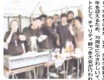
ポテト、焼きそばを売る模擬店に集う

第18回さつき野祭大学祭は、小春日和の好天に恵まれた11月20日(土)に開催された。学生自治会では、25名で大学祭実行委員会を作り、連日準備を進めた。また土日の休みを返上して準備を進めた。また、来年度創立70周年を迎えるため、70周年にふさわしいイベントとして「チャリティ餅つき大会」が行われた。 教育後援会・学生・教職員が力を合わせて、ベッタコベッタコと杵を振り回していった。餅つきは、無料でいたいただき、併せて大雨・台風及び新潟県中越地域等で多大な被害を受けた地域の方への集まった募金3万6459円は自治会代表によって毎日新聞大阪社会事業団を通じて、被災者に届けられた。R OUTE 71 THE ANGLAS・THE ROAD TO PEACE等九つのグループが熱演し、大きな歓声と拍手に沸いた。会場には、模擬店が10店舗出され、自分達で作った商品を多く売ろうとする大きな掛け声で終日賑わっていた。大学祭のメインイベントのビンゴ大会は、多数の参加者に囲まれてメインステージで行われた。折りたみ自転車・DVDプレーヤー・プレイステーション2・空気清浄機等豪華賞品が用意され、ビンゴが出るたびに大きな歓声が沸いた。 *第18回さつき野祭(大学祭)は、盛會裡に終了した。大学祭実行委員の皆様、大変お疲れさまでした。