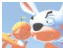
こんなアニメが可能に

ペレーション・サイトを作り上げるまでの流れなどを25時間でWeb制作に必要な基礎を習得する。最終的には、機能的なサイトの実制作を通してナビゲーションやグラフィックス面での理解を深める。 3DCGアニメコース 50時間 前半25時間で基本的なモデリング・アニメーション、レンダリングを習得、後半に作品として仕上げるための土台を作る。さらに作りながら映像の概念効率のいい制作プロ