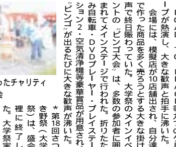
心こもったチャリティ餅つき大会