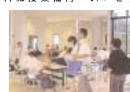
賑わうA E面談・個別相談会場

プログラムは、本学を体験する。に重点を置きながら、「楽しむ」内容を充実させ、思い出に残るようなイベントを用意している。在学生の案内誘導により、公開授業・研究室を訪問してみよう。各学科ごとに毎回開催して、参加者はどの学科でも必ず体験できるようにした。最も関心の深い「入試情報説明会」は、参加した人しか入手できない最新入試情報を提供するとともに、過去2年分の入試問題(抜粋)をプレゼントした。新設した「占いコーナー」は、情報推命学のベテラン占い師7名が担当。人生・進路・恋愛等の占いは大変人気があり、受付時間待ちの人が多数あった。学食を体験しようは、ランチバイキングのうえ、フリードリンクでケーキとアイスクリームが食べ放題で、昼食の時間帯はたくさんの人で大盛況であった。アンケート提出者、スタンプラリー3個以上の人には、特等から8等までの景品が当たる抽選会が行われた。ぬいぐるみやゴムボール等の豪華景品が当たると大きな歓声が上がっていた。