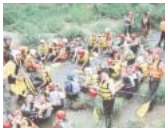
さあ出発、緊張のひととき