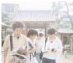
竹内街道の説明に耳を傾ける学生たち