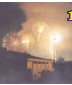
夜空を焦がす大花火

今年も事務職員全員で事前準備を行い、当日もご来場の皆様に対応にあたり、また学友会が地元住宅地を戸別訪問して、「大学開放」をPRしたり、模擬店で場内を盛り上げ、大変な活躍ぶりであった。