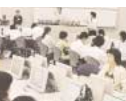
保護者も一緒に心理学テストを体験