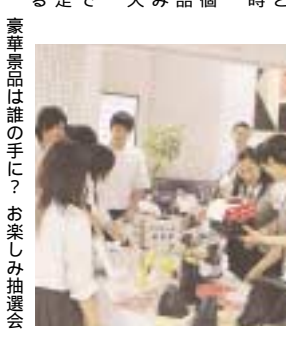
豪華景品は誰の手に? お楽しみ抽選会

情報推命学の占い師による占いコーナー プログラムは、本学を体験する。に重点を置きながら、「楽しむ」内容を充実させ、思い出に残るようなイベントを用意している。在学生の案内誘導により、公開授業・研究室を訪問してみよう。各学科ごとに毎回開催して、参加者はどの学科でも必ず体験できるようにした。最も関心の深い「入試情報説明会」は、参加した人しか入手できない最新入試情報を提供するとともに、過去2年分の入試問題(抜粋)をプレゼントした。新設した「占いコーナー」は、情報推命学のベテラン占い師7名が担当。人生・進路・恋愛等の占いは大変人気があり、受付時間待ちの人が多数あった。学食を体験しようは、ランチバイキングのうえ、フリードリンクでケーキとアイスクリームが食べ放題で、昼食の時間帯はたくさんの人で大盛況であった。アンケート提出者、スタンプラリー3個以上の人には、特等から8等までの景品が当たる抽選会が行われた。ぬいぐるみやゴムボール等の豪華景品が当たると大きな歓声が上がっていた。