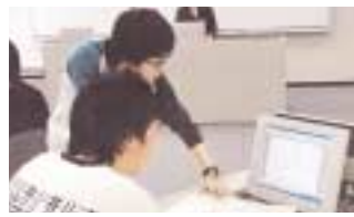
大成功だった先輩による指導