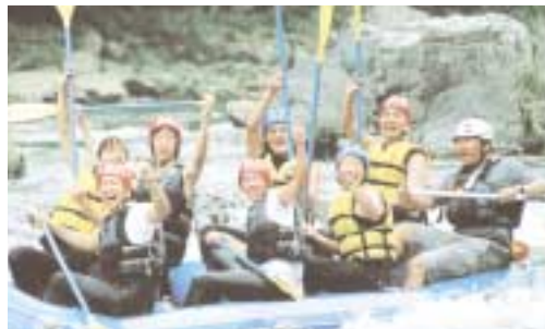
チームワークで難所をクリアー、歓声あがる！