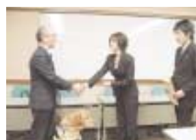
使用上の注意点や心肺蘇生法についての講習会の開催を考えている。

本学の玄関ホールに「AED」(自動体外式除細動器)が設置され、1月26日(金)午後、教職員を対象に講習会を開催し12人が出席した。本館のメーカ「フクダ電子」のAEDインストラクターから、30分間にわたって取扱い方法、留意点などの説明を質疑応答を交えて聞いた後、実物とそっくりの模型を使った実演を試みた。AEDは2004(平成16)年7月から、空港、駅、球場などの公共施設に設置されるようになった。本学では、今後も