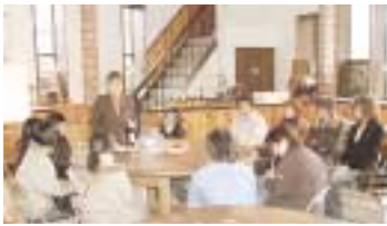
ワインの味わい方やマナーも教わる学生たち