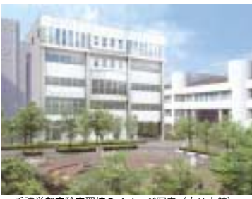
看護学部実験実習棟のイメージ写真(右は本館)

〒587-8555 大阪府堺市美原区平尾 電話 072-362-3731/FAX 072-362-0598 監修:学校法人 天満学園 学園企画室