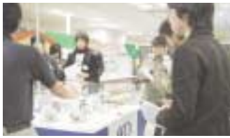
「クリーンエネルギー自動車コーナー」で真剣にメモを取る学生たち

心理学科人間文化学科の1年次生70人が、12月16日(土)午後2時から5時30分頃まで「AECグリーンエネコラガ(大阪府住之江