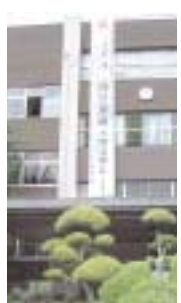
矢野選手の活躍を讃える垂れ幕

昨年12月1日からカタールの首都ドーハで開催された、第15回アジア競技大会に出場した競泳の部で矢野友理江選手が、個人競技2種目で金メダル、団体のリレーで銀メダルを獲得する大活躍をした。 200mバタフライでは第一人者である中西悠子選手を破っての金、専門外の800m自由形は高校新記録での金メダルで、申し分のない2冠を達成した。 同選手は日本水泳連盟から、3月17日開幕の世界選手権(メルボルン)での女子競泳バタフライの代表選手に選ばれた。