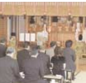
安全祈願祭(出雲大社高津大教会にて)