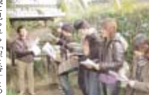
聖徳太子ゆかりの太子町を「陵の谷」として知られていて、また蘇我馬子など蘇我氏にかかわる遺跡もあり、中学・高校の社会科授業でおなじみの歴史的人物の宝庫である。全員徒歩で調査地点を探索し、現代の景観に見られる「聖と俗」との絡み合いについて理解を深めた。長い道程で疲れは多少あるものの、先生に質問しながらの4時間の調査は楽しく実りあるものであった。