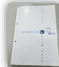
TGU.net利用ガイド (B5サイズ)

看護学部の学生のみなさんは、箱の中に同封している資料を元に、以下アプリの導入もお願いいたします。