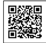
医学書院 ライブラリー https://my.islib.jp/

TEL : 03-3817-5661、mail : sd@igaku-shoin.co.jp